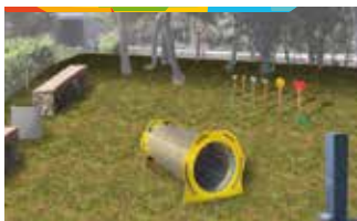
1. ZONA ESBARJO GOSSOS CAMÍ DEL VENDRELL - C. OSSA MAJOR

Creació d'una zona d'esbarjo per a gossos d'uns 1.000 metres quadrats, on les mascotes puguin córrer, jugar i relacionar-se entre elles. L'àrea estarà envoltada per una tanca metàl·lica i hi haurà bancs, papereres on dipositar els excrements, jocs i una font perquè els animals puguin beure aigua.