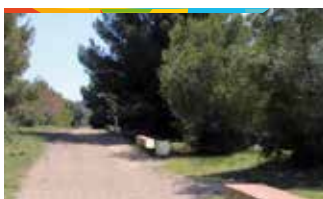
3. ZONA VERDA C. ROSA SENSAT

Arranjament de la zona, amb una extensió de més de 43.000 metres quadrats, per convertir-la en una via verda amb l'adequació del camí i la instal·lació de bancs i papereres i el plantat d'arbrat autòcton.