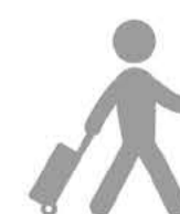
ASISTENCIA EN VIAJE