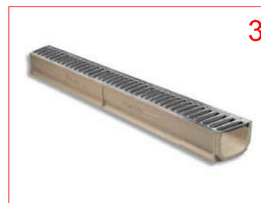
TIPUS DE CANAL POLIMER A NETEJAR