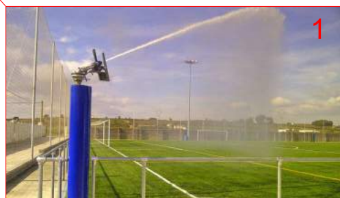
CANÓ DE REG ELEVAT