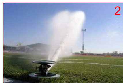
CANÓ DE REG ESCAMOTEJABLE