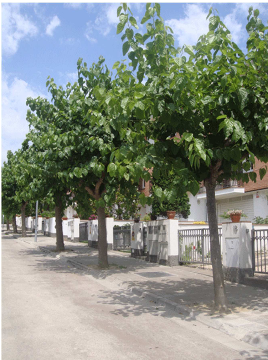
Morus Alba fruitless