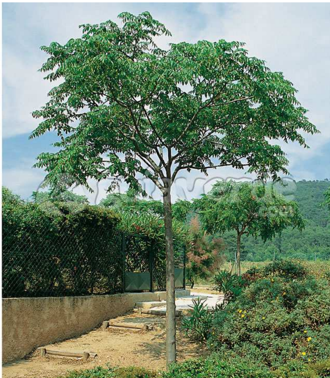
Melia en cepello 14/16