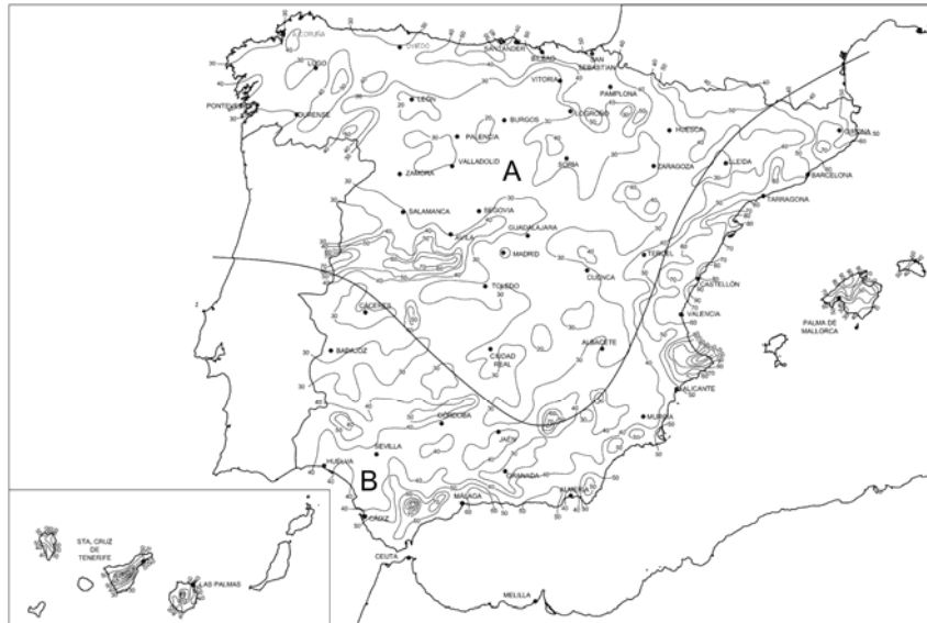
Mapa de isoyetas y zonas pluviométricas