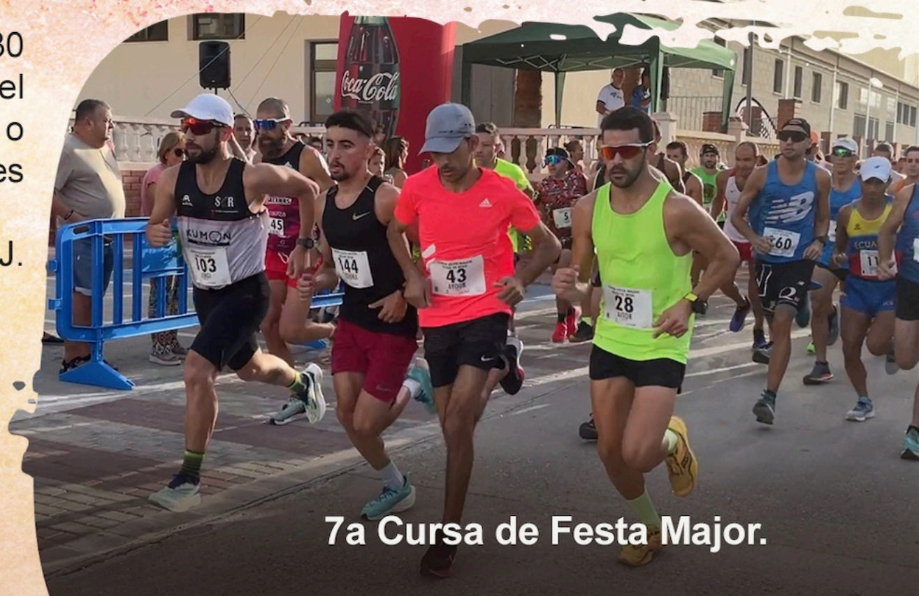
7a Cursa de Festa Major.

La venda de les taules serà el dia 10 i 11 d'agost de 9 a 12 hores al vestíbul del Poliesportiu. (caldrà pagar amb metàl·lic). Preu de l'entrada del Ball de Festa Major del dia 24 d'agost: Entrada general 5€, i jubilats 1€ (venda d'entrades el mateix dia).