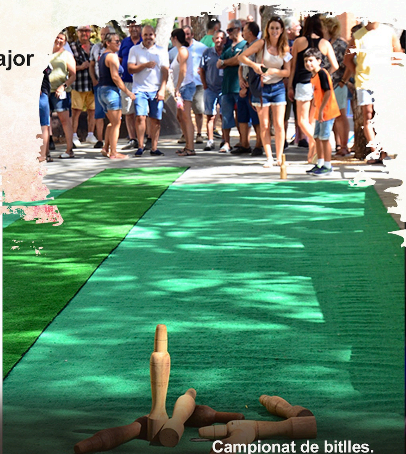
Campionat de bitlles.

Atreveix-te a provar l'XtremRace, una activitat divertida, esportiva i plena d'acció. També hi haurà inflables per als més menuts.