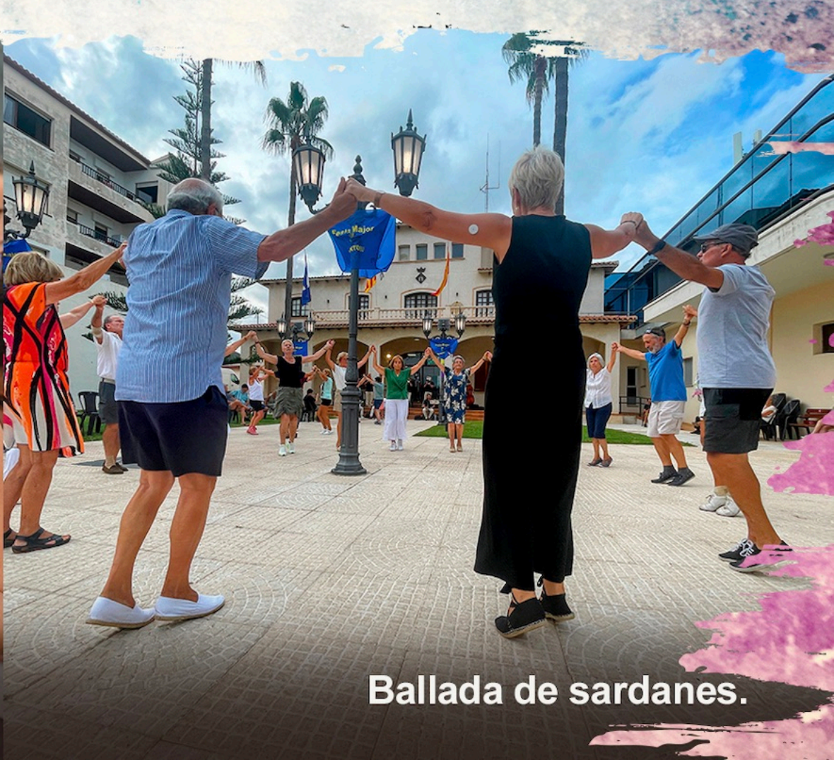
Ballada de sardanes.