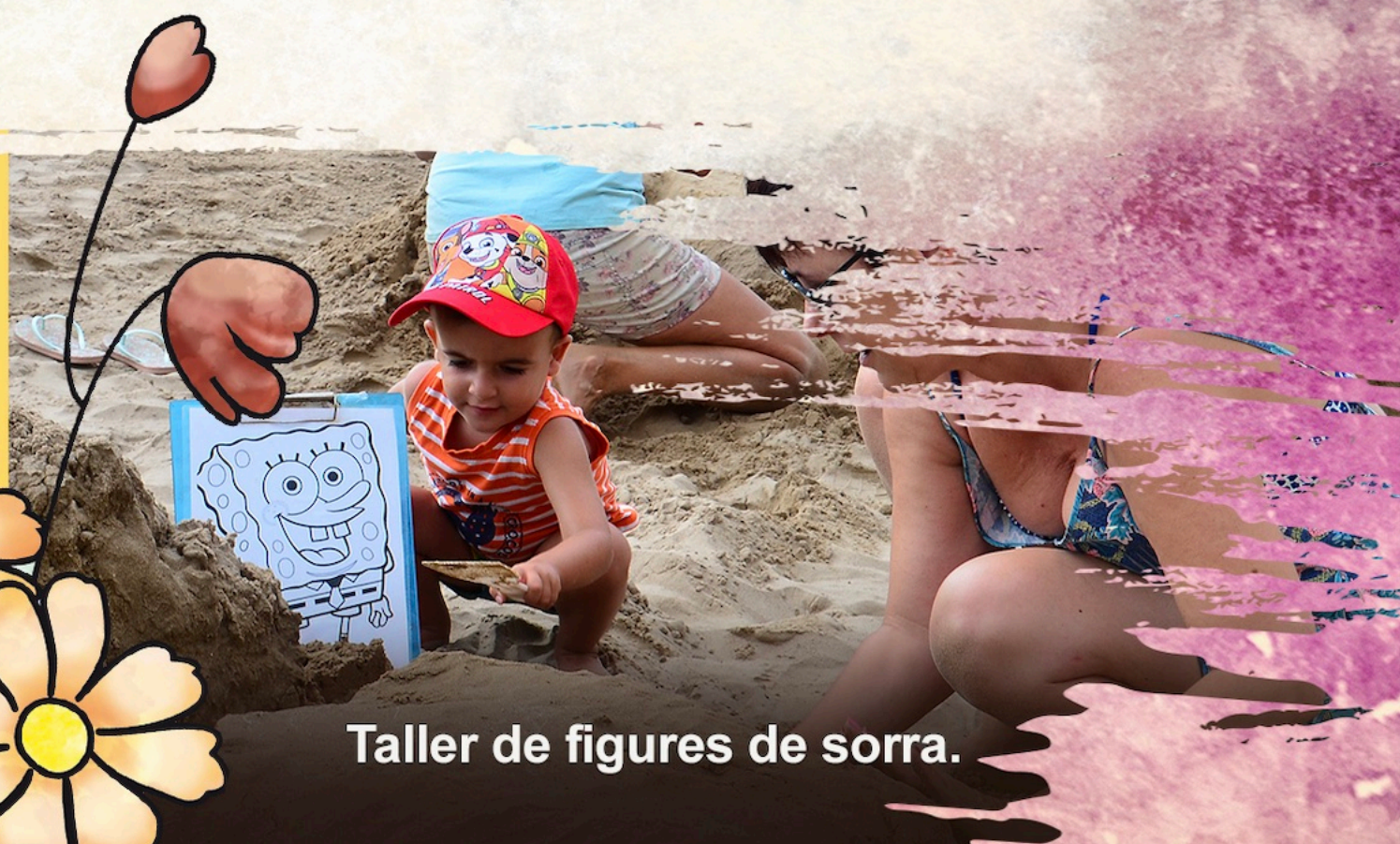
Taller de figures de sorra.