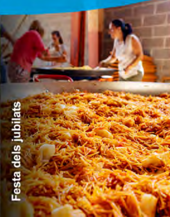
Festa dels jubilat